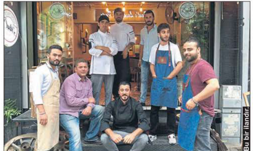
Bu bir ilandır.

Aslında bakarsanız Kadıköylüler'in çoğu bizi bilmiyor. Müşterilerimizin yüzde 10'u Kadıköylü. Bunun bu röportajla değişeceğini umuyorum.